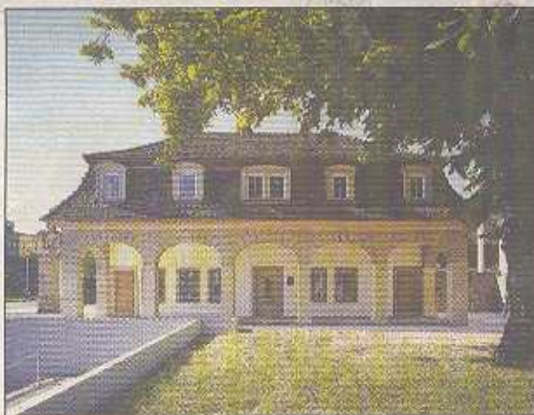
Das Stuttgarter Torhaus.

Die konzertierte Aktion aller Torhäuser, die von sechs unterschiedlichen Organisationen bespielt werden, wurde in ähnlicher Form bereits am Tag des Denkmals durchgeführt. Nun, im 300. Jahr seit dem herzoglichen Aufruf des Herzogs von Württemberg zur Ansiedlung in Ludwigsburg, können die aufwändig, ja liebevoll restaurierten Wachhäuser der ehemaligen Stadtmauer wieder an einem Tag in Augenschein genommen. Wer möchte, der kann die kurzen Passagen von Torhaus zu Torhaus spa-