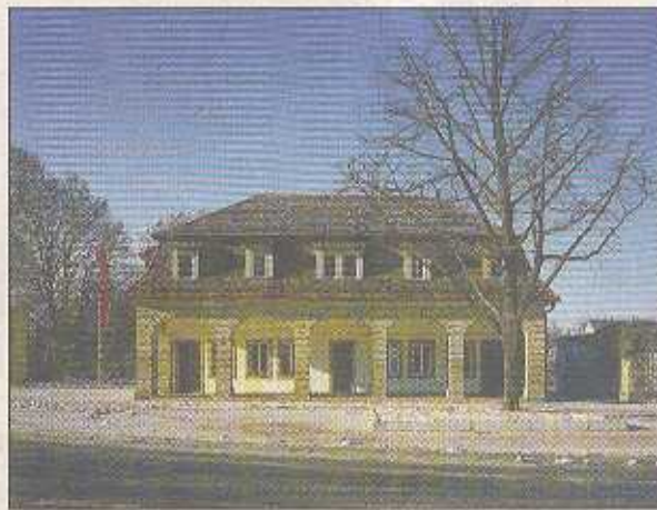
Das Pflugfelder Torhaus.