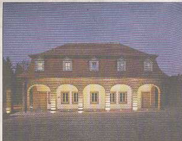
Das Schorndorfer Torhaus.