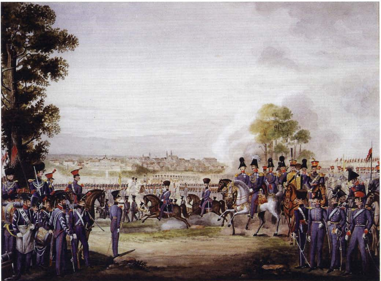
Revue des württembergischen Heeres vor König Wilhelm I. bei Ludwigsburg, 1835. In der rechten Bildhälfte in der Uniform des Leib-Garde-Husaren-Regiments Prinz Wilhelm von Preußen, der spätere Kaiser Wilhelm I.

Nachdem die bei der letzten Parade vorgespielten Geschwindmärsche den Vorstellungen des Königs nicht entsprochen hatten, forderte im Februar 1834 das Kriegsministerium die Kapellmeister der 1., 2. und 3. Infanteriebrigade auf, neue Ordonnanz-Geschwind-