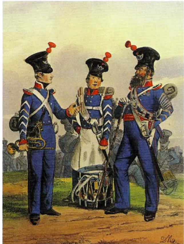
Hoboist, Tambour und Regimentstambour, Königreich Württemberg 1833.

2 Trompeten, 1 Posaune [gestrichen], 21 Mann mit Inbe-